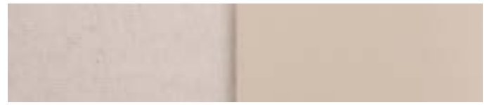
natur RAL Hellelfenbein