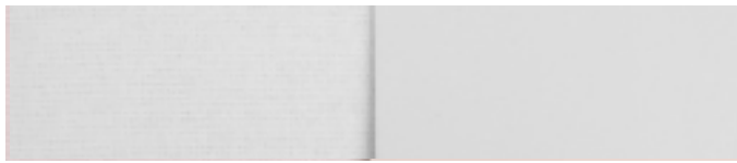
weiß RAL Signalweiss