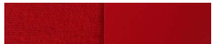
rot RAL Himbeerrot