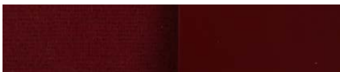
bordeauxrot RAL Weinrot