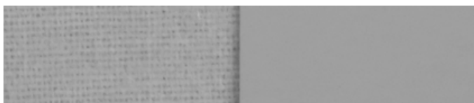
hellgrau RAL Seidengrau